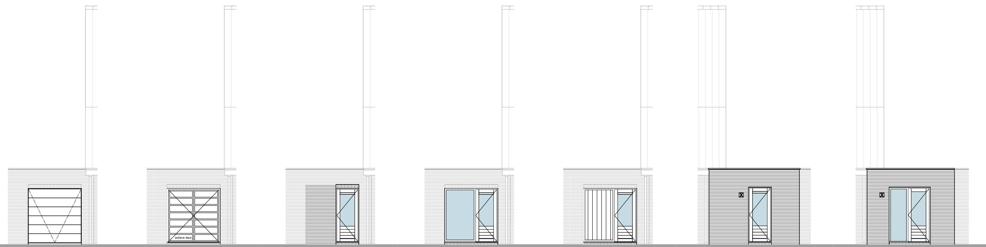
VOORGEVEL VOORGEVEL VOORGEVEL VOORGEVEL VOORGEVEL ACHTERGEVEL ACHTERGEVEL BO-0185 BO-0186 BO-0190 BO-0191 BO-0192 BO-0114 BO-0022/0023